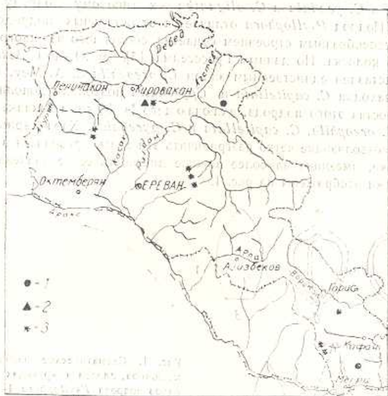
Рис. 2. Распространение видов подрода Psyllophora в Южном Закавказье: 1 — C. capitellata Bolss. et Bal., 2 — C. pyrenaica Wahlenb., 3 — C. oreophila C. A. Mey.

Разными авторами [4, 5, 8, 10] C. capitellata приводился из нескольких флористических районов Кавказа: Западного Кавказа, Западного, Центрального, Закавказья и Карабаха (гора Кошкар-Даг).